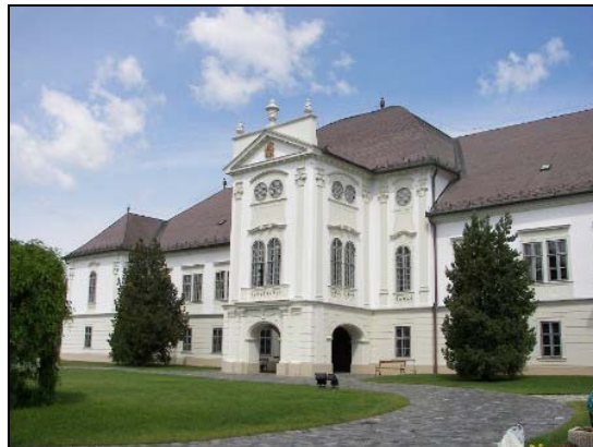
A szécsényi kastély

Szécsény leglátványosabb épülete. A magyar vidék, barokk építészet értékes emléke. 1753-1763 között készült el a Forgách család részére.