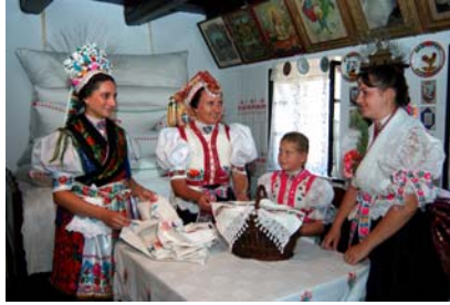
Varsányi népviseletet asszonyok

Bár népviseletes emberekkel inkább csak ünnepek idején találkozhatunk, érdemes végig sétálni az utcákon, hiszen sok szép, régi palóc lakóház maradt fenn a faluban.