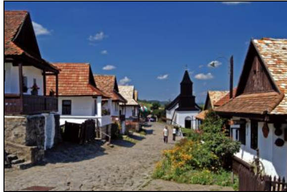
Az ófalu főutcája

Pajtakert, fafaragóház, kerámiaház, szövőház Kossuth út 46. Tel.: 32/379-273 Nyitva tartás: Márc.1-Nov. 30: K-V 10-17 óráig