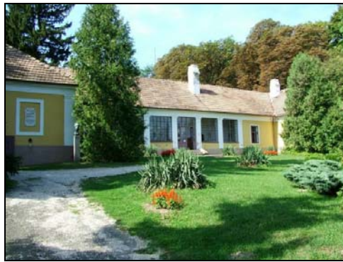
Madách Imre emlékmúzeum

1862 augusztusában nevezetes találkozás színhelye volt az udvarház, Madách itt fogadta a Tragédia felfedezőjét, Arany Jánost.